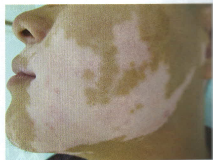
中西醫對白蝕成因有不同見解，而中醫會根據出現位置，以不同的處方來醫治。