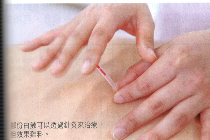
部份白蝕可以透過針灸來治療，但效果難料。